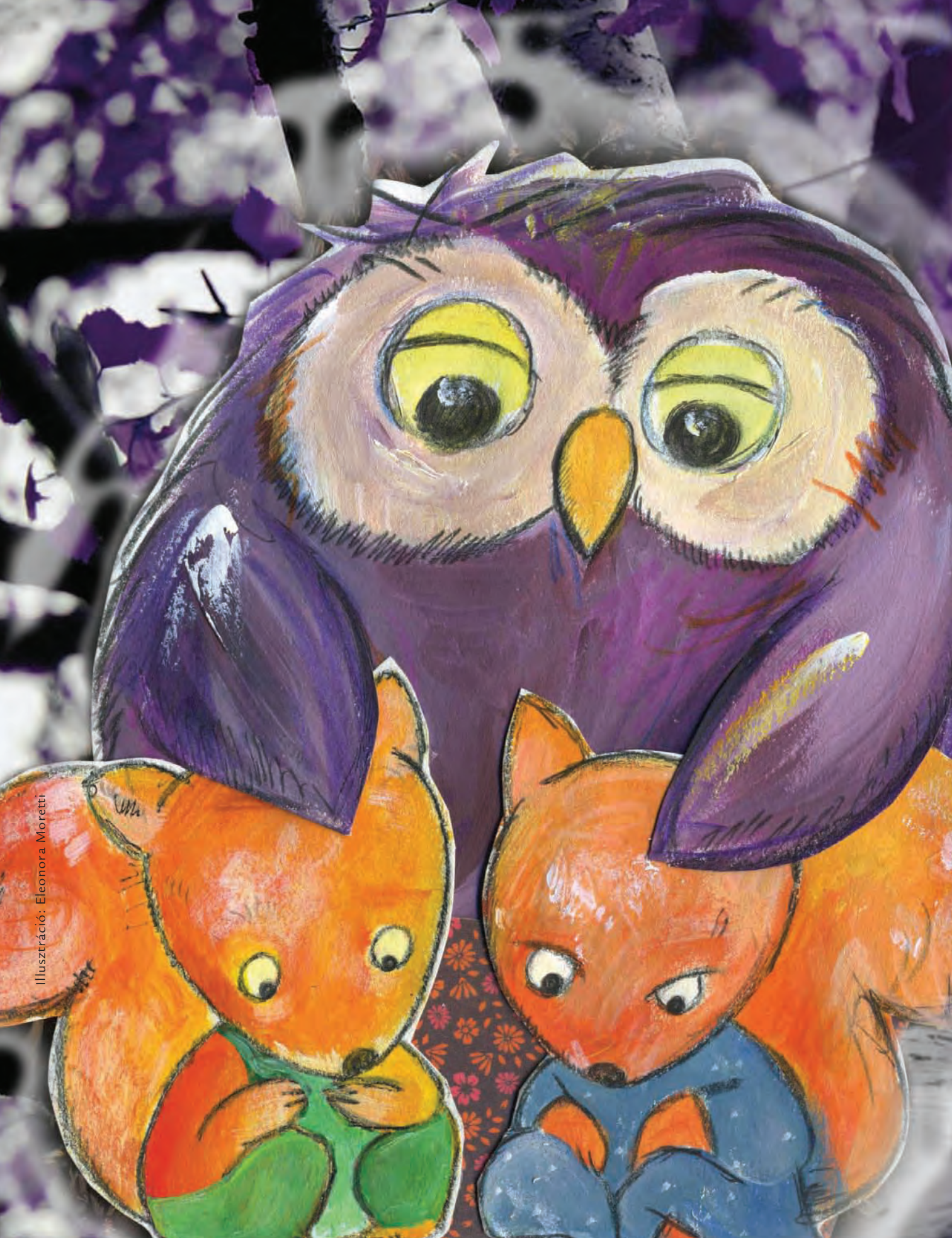
Ilustráció: Eleonora Moretti