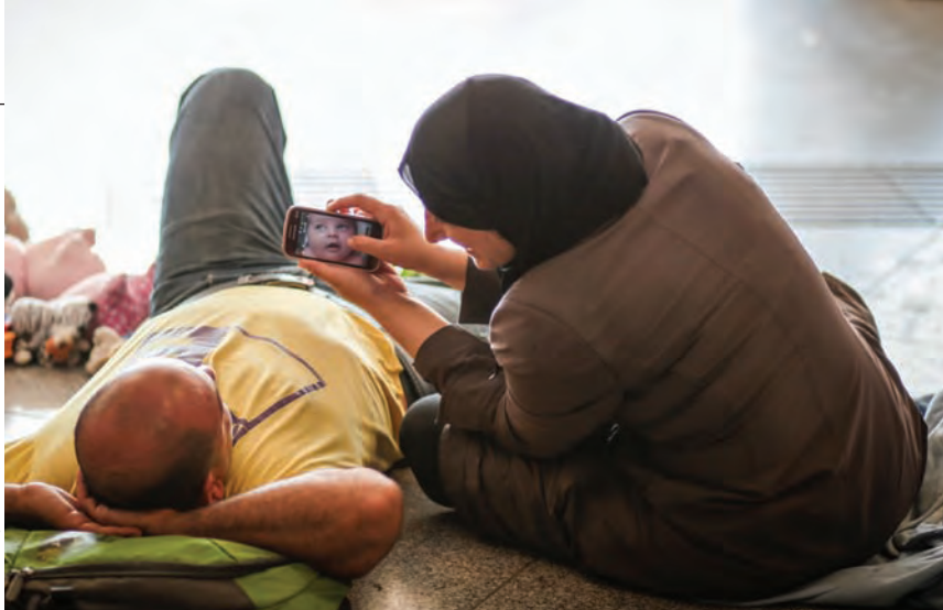
Fotó: Merényi Zita (2)