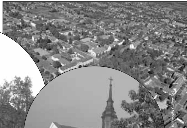
Reiniszekéi Csabór (3)

dokban megélt élet a város életének alapja, ezért a családoknak is tartunk programokat, hogy a kapcsolatokat erősítsük.